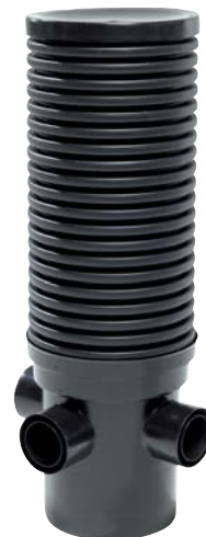
Bottenelement för granskningsbrunn