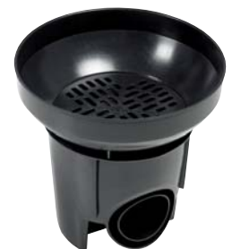
MX-Dränbrunn SVK 300/100-110 mm