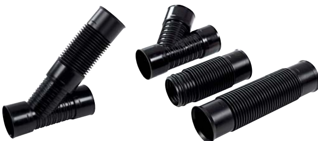
Flexbøj och flexgrenrör SN8