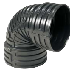
Bøj med två muffar