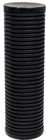
Granskningsbrunn för täckdike